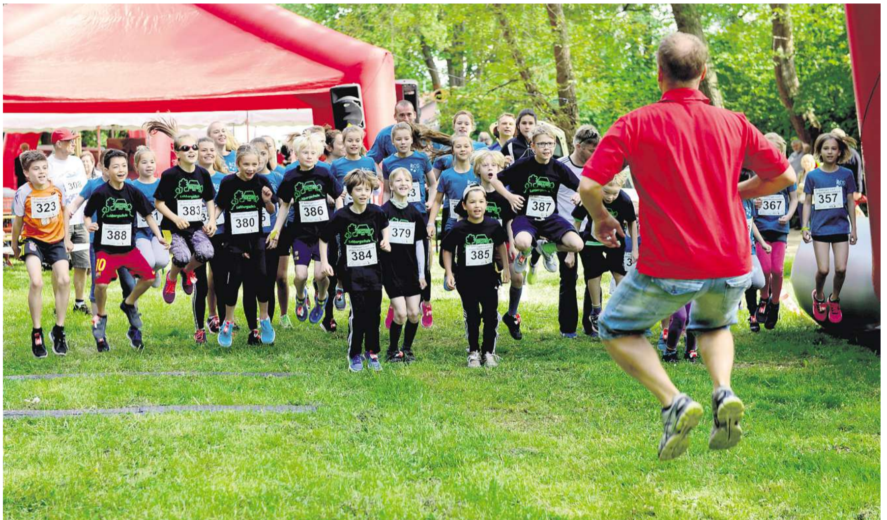
Auf die Plätze, fertig, los! Menschen aller Altersklassen nehmen am Lauf gegen Bluthochdruck in Göttingen teil.

STADTHAGEN. Ein British Weekend richtet das Rittergut Remeringhausen aus. Um sich dem englischen Lebensgefühl hinzugeben, können Anglophile am Sonnabend und Sonntag, 4. und 5. Juni, das Gut in Stadthagen ab 10 Uhr besuchen. Neben Polo Crosse und Cricket heißt es am Sonnabend unter anderem ab 17.30 Uhr „God save the Queen“. Zum 90. Geburtstag soll der Queen ein Ständchen gesungen werden. Das Tageblatt verlost für das British Weekend fünfmal zwei Karten. Leser, die am Montag, 23. Mai, zwischen 10 und 16 Uhr anrufen und deutlich ihren Namen, ihre Anschrift und ihre Telefonnummer hinterlassen, können gewinnen. Die Teilnahme ist unter Telefon 0137 / 979 64 48 möglich (0,50 Euro pro Minute aus dem deutschen Festnetz, Preise aus dem Mobilfunknetz können abweichen). Der Rechtsweg ist ausgeschlossen. bl